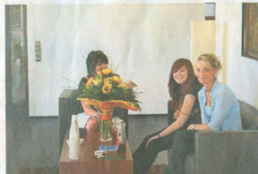
Kann kein Schaden sein: Sich einmal ungezwungen mit dem Thema Tod und Bestattung auseinandersetzen.