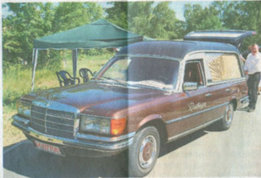
Historische Bestattungsfahrzeuge zeigte die Interessensgemeinschaft für deren Erhalt.