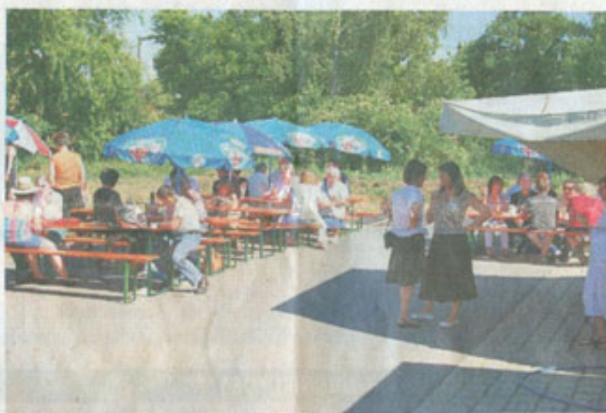
Sehr gut angenommen wurde das Verpflegungsangebot.