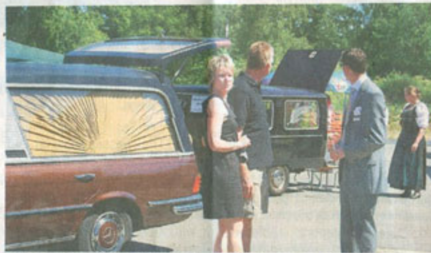
Zum Tag der offenen Tür kam ein sehr interessantes Publikum.

Dem Tag der offenen Tür voraus ging am Samstag, 31. Mai, die Eröffnung für geladene Gäste. Offizielle Repräsentanten wie auch Bestatterkollegen von mehr als 50 Instituten aus ganz Deutschland nahmen die Einladung gerne an. Dank des Neubaus bekommen Angehörige professionelle und umfassende Beratung zu allen Leistungen des Bestattungsinstituts Pietät in hellen, freundlichen Räumen.